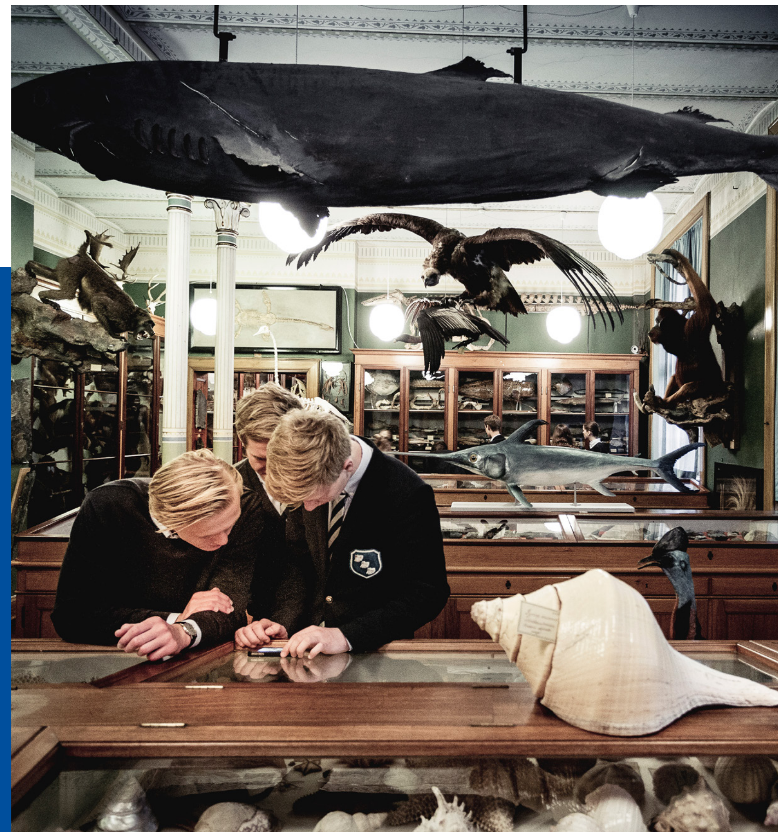
Herlufsholm er en skole med masser af historier. Vi har f.eks. hele tre forskellige historiske samlinger. Billedet her er fra den naturhistoriske.

Har du lysten, og har du viljen? Og tør dine forældre give slip? Vi er klar!