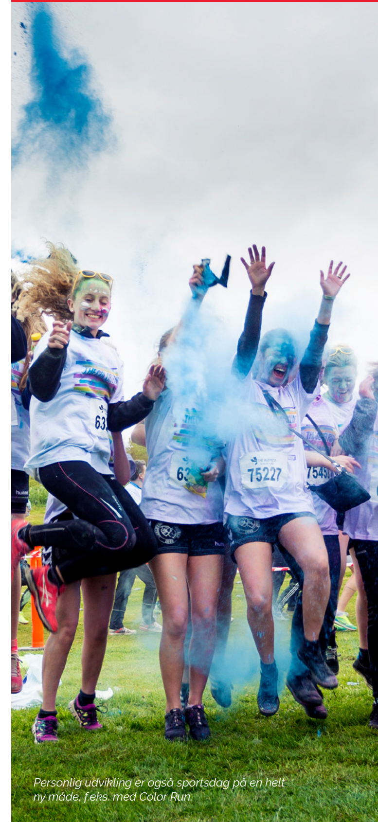
Personlig udvikling er også sportsdag på en helt ny måde, f.eks. med Color Run.

Og så er der vores mange rejser, traditioner og fester. De er også med til at udvikle dig – uanset om vi er på frivilligt arbejde i Brasilien eller går i procession en mørk januar morgen på Herluf Trolles fødselsdag forbi gravmælet ovre i kirken, mens orglet bruser, og rummet kun er oplyst af levende lys.