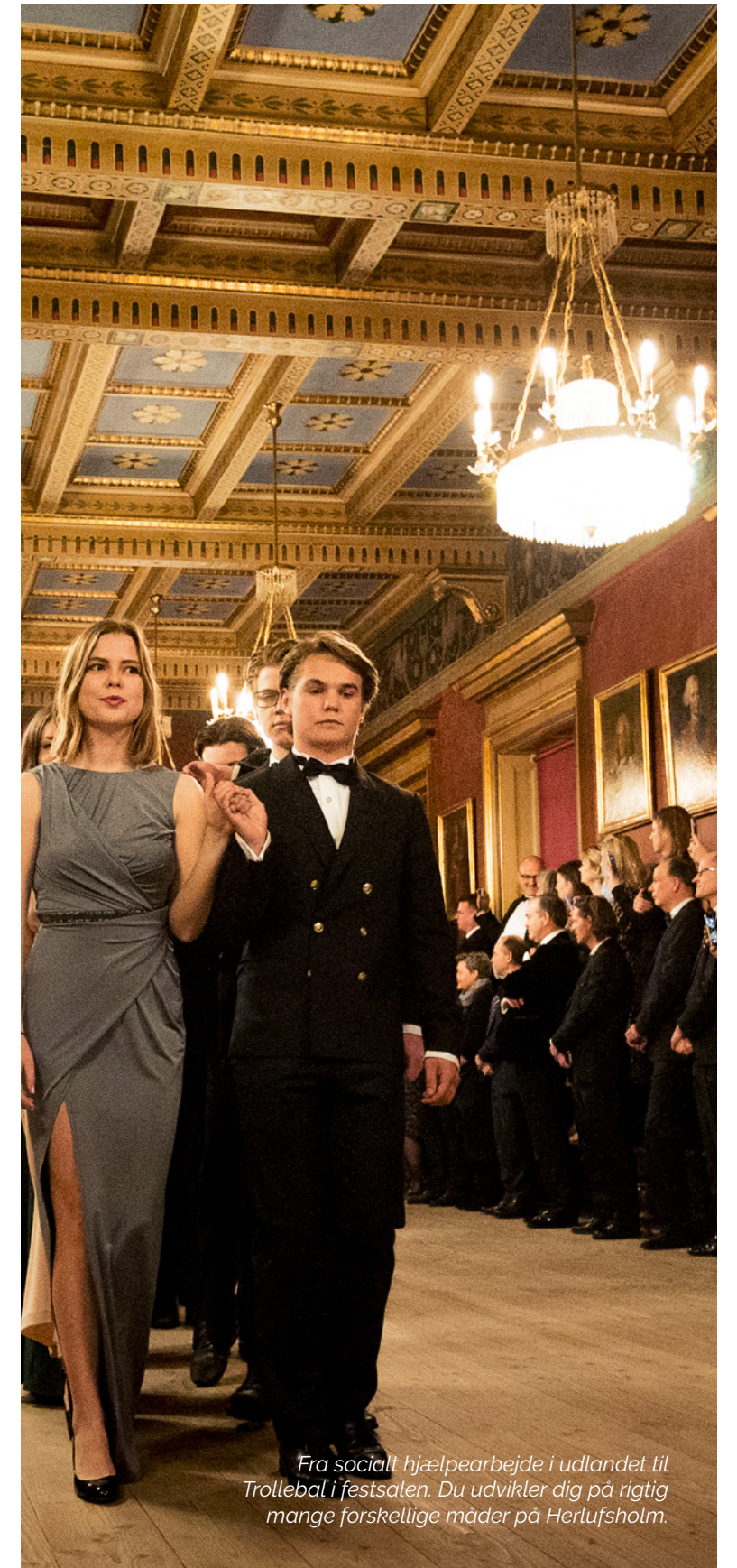
Fra socialt hjælpearbejde i udlandet til Trollebal i festsalen. Du udvikler dig på rigtig mange forskellige måder på Herlufsholm.