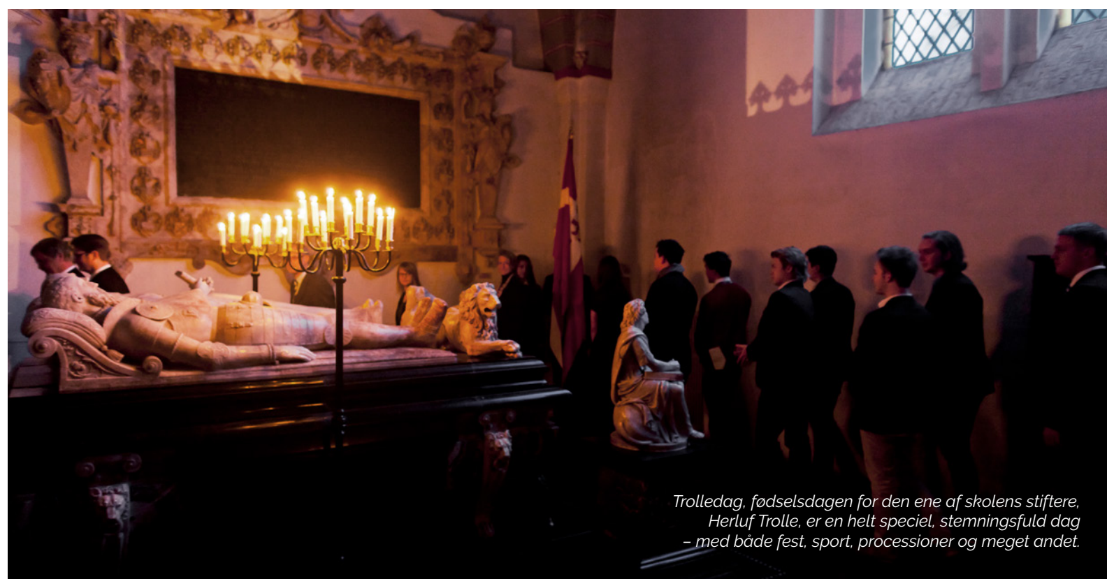
Trolledag, fødselsdagen for den ene af skolens stiftere, Hertuf Trolle, er en helt speciel, stemningsfuld dag – med både fest, sport, processioner og meget andet.

Og så er både Herlufsholm og Næstved steder, hvor du trygt og frit kan bevæge dig rundt. Kommer du fra udlandet, vil du i det hele taget opleve, at Danmark er et utroligt nemt og sikkert sted at være ung.