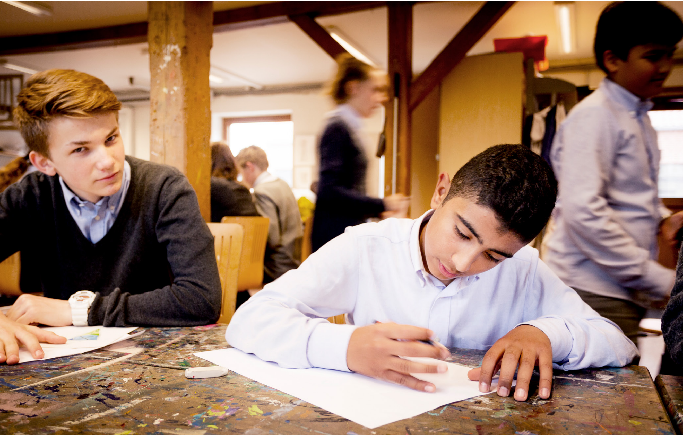
På Herlufsholm bliver du for alvor global! Du møder det nye, spændende og anderledes i både undervisningen, og når vi rejser ud i verden.

V ær nysgerrig, se dig omkring i verden! Herlufsholm er en skole for nysgerrige, for dig, der vil udvide din horisont. Det kommer du til på flere måder! F.eks. vil du opleve, at dine kammerater ikke kun kommer fra ét sted i Danmark, men fra hele Danmark. Og hele verden! Flere har forældre, der bor og arbejder i udlandet.